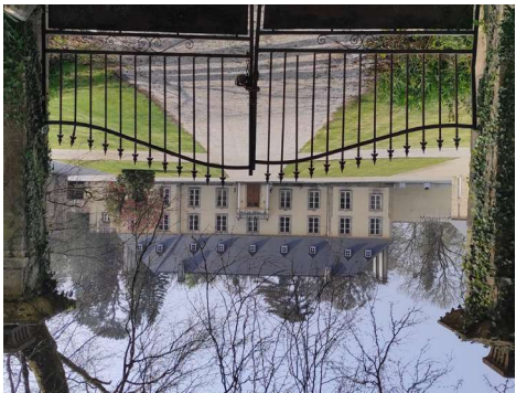
4. LE CHÂTEAU DE ROCHEMONT

Le château date du XVIII e siècle et a été construit par les ancêtres de la famille De Mondésir qui possédera la propriété jusqu'en 1994.