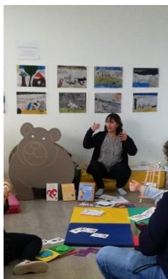
Atelier parent-enfant « communication gestuelle associée à la parole » 12 novembre à la bibliothèque de Bricquebec-en-Cotentin